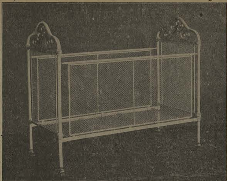
200 LITS D'ENFANTS dans toutes les dimensions.

Pour vos LITS ANGLAIS Lits d'enfants, lits cage, lits d'hôpitaux, pour logements, etc.; Installation d'hôtels, etc.