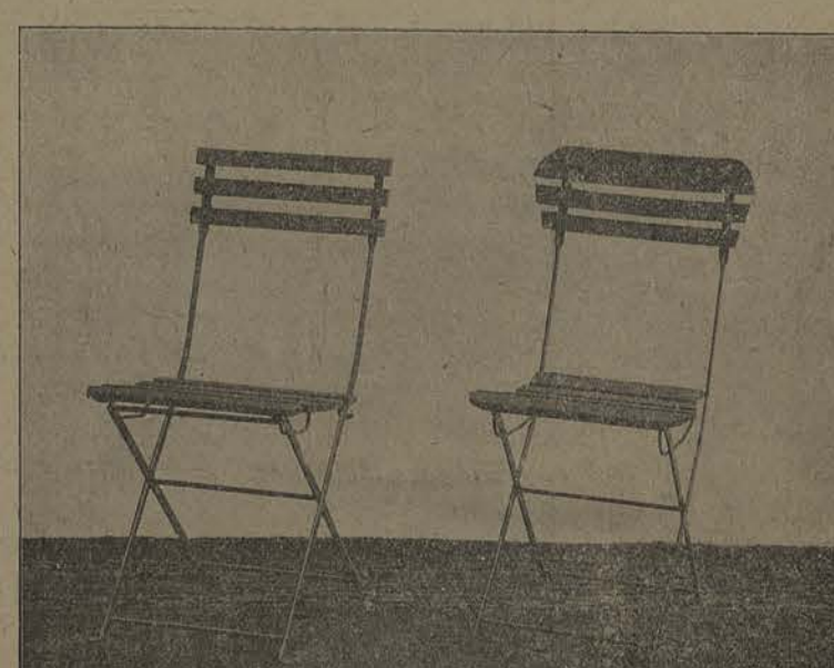
CHAIRES & BANCS POUR TERRASSES.