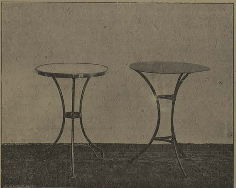
TABLES DE JARDINS & CAFÉS.

Dans votre intérêt, prenez bonne note que SÉQUARIS ne vend que l'article en fer et non pas l'ameublement.