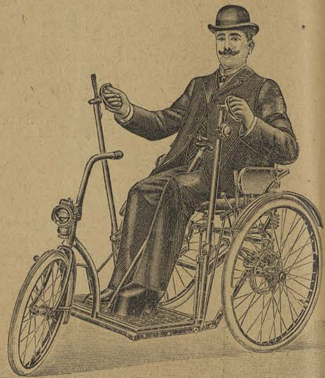
VOITURES MÉCANIQUES ET AUTRES pour toutes infirmités et maladies ASSORTIMENT COMPLET