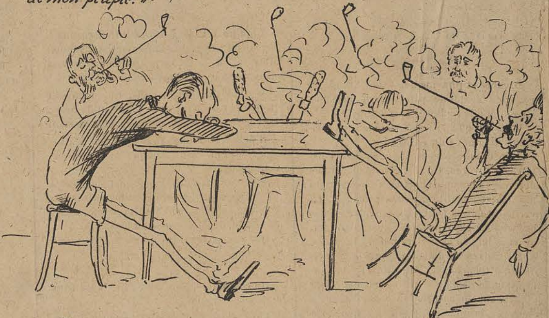
"Et l'on s'occupe plus activement, que jamais à Liège d'organiser des fêtes pour célébrer le centenaire de la Révolution de 1789!"