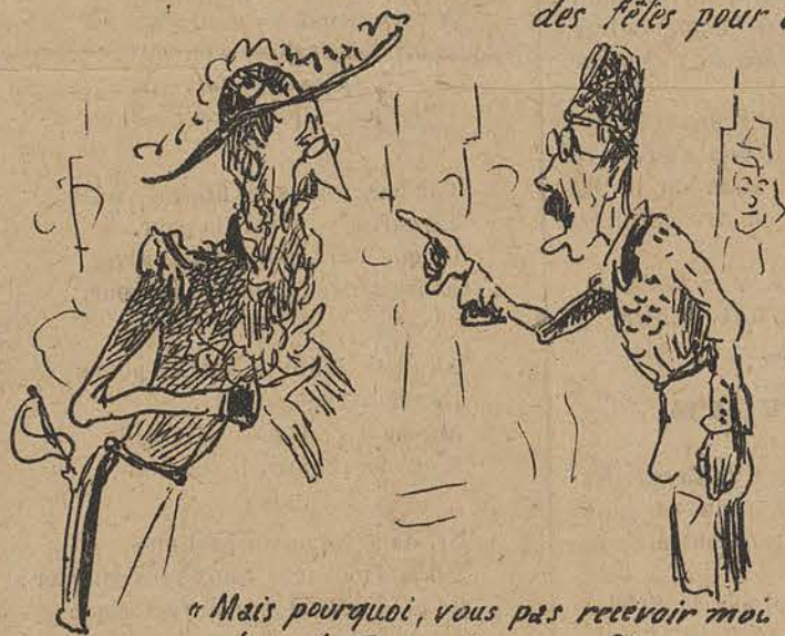
"Mais pourquoi, vous pas recevoir moi au palais de Bruxelles?" — "C'est uniquement par déférence pour vous: si vous saviez comme on est obligé de vivre pauvrement chez moi."