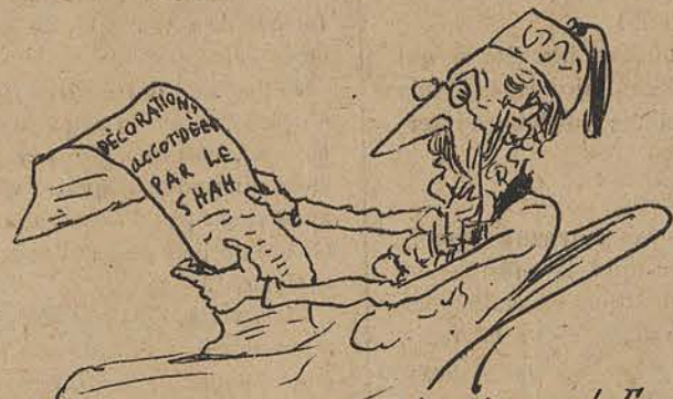
"Sapristi, quelle concurrence désastreuse! Et moi qui m'imaginai que l'ordre de Léopold suffisait au bonheur de mon peuple."