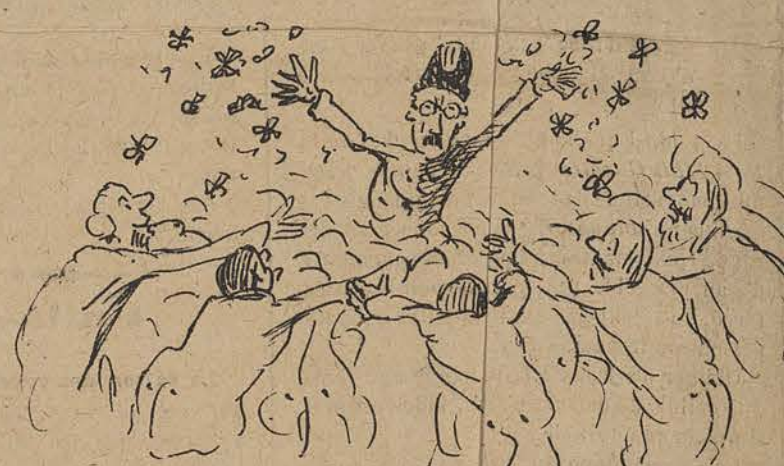
Pour peu que cela continue, il n'y aura bientôt plus un seul Belge, majeur et vacciné qui ne soit décoré de l'ordre du Shah de Perse. Quelle gloire pour notre petit pays!"