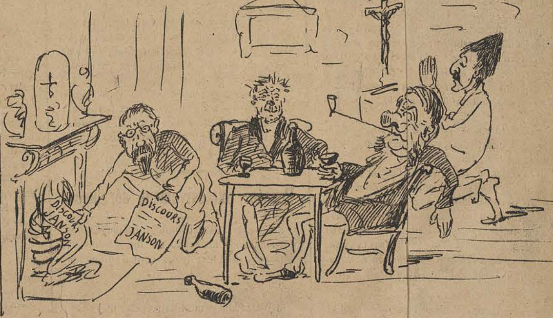
Le calme après la tempête. "Le ciel n'est pas plus pur que le fond de leur cœur."