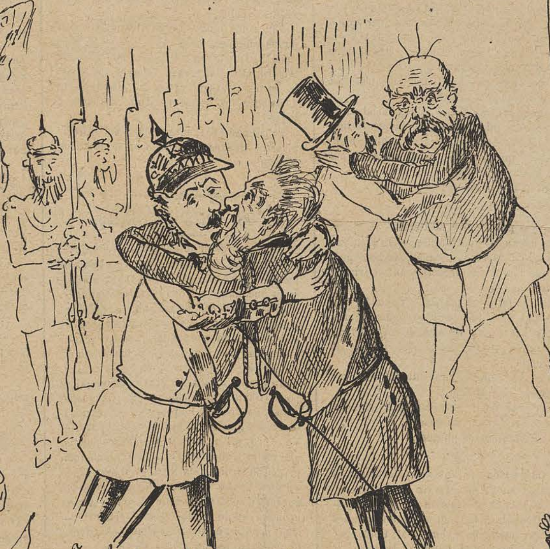
Coubante alliance de la choucroute et du macaroni ; seulement, gare les indigestions.