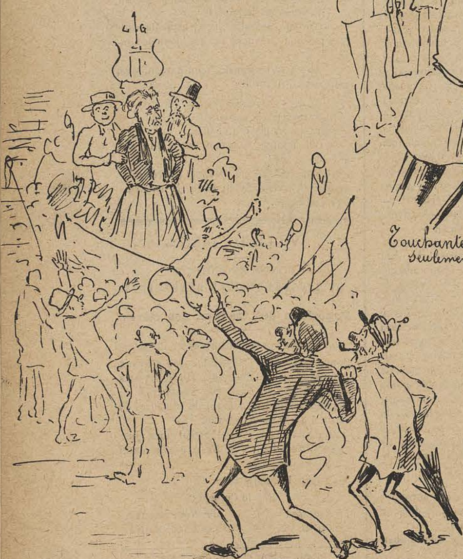
A la Cavalcade de l'Est. « Tiens ! voilà Grétry, on le conduit sans doute à la germanence. »