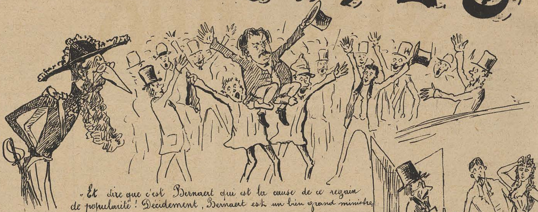
« Et dire que c'est Bernaert qui est la cause de ce regain de popularité ! Décidément, Bernaert est un bien grand ministre. »