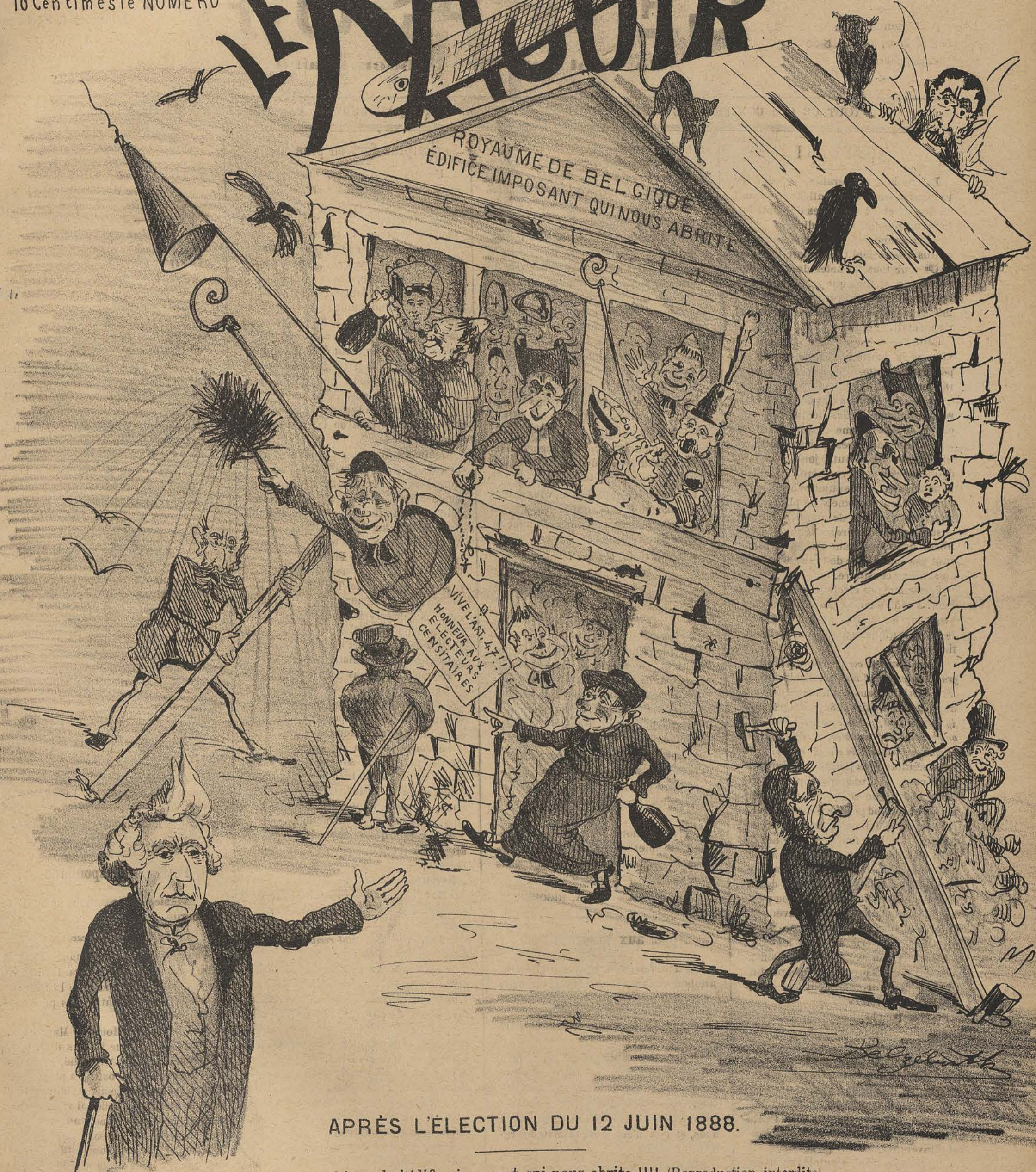
APRÈS L'ÉLECTION DU 12 JUIN 1888.

Vue photographique de l'édifice imposant qui nous abrite !!!! (Reproduction interdite).