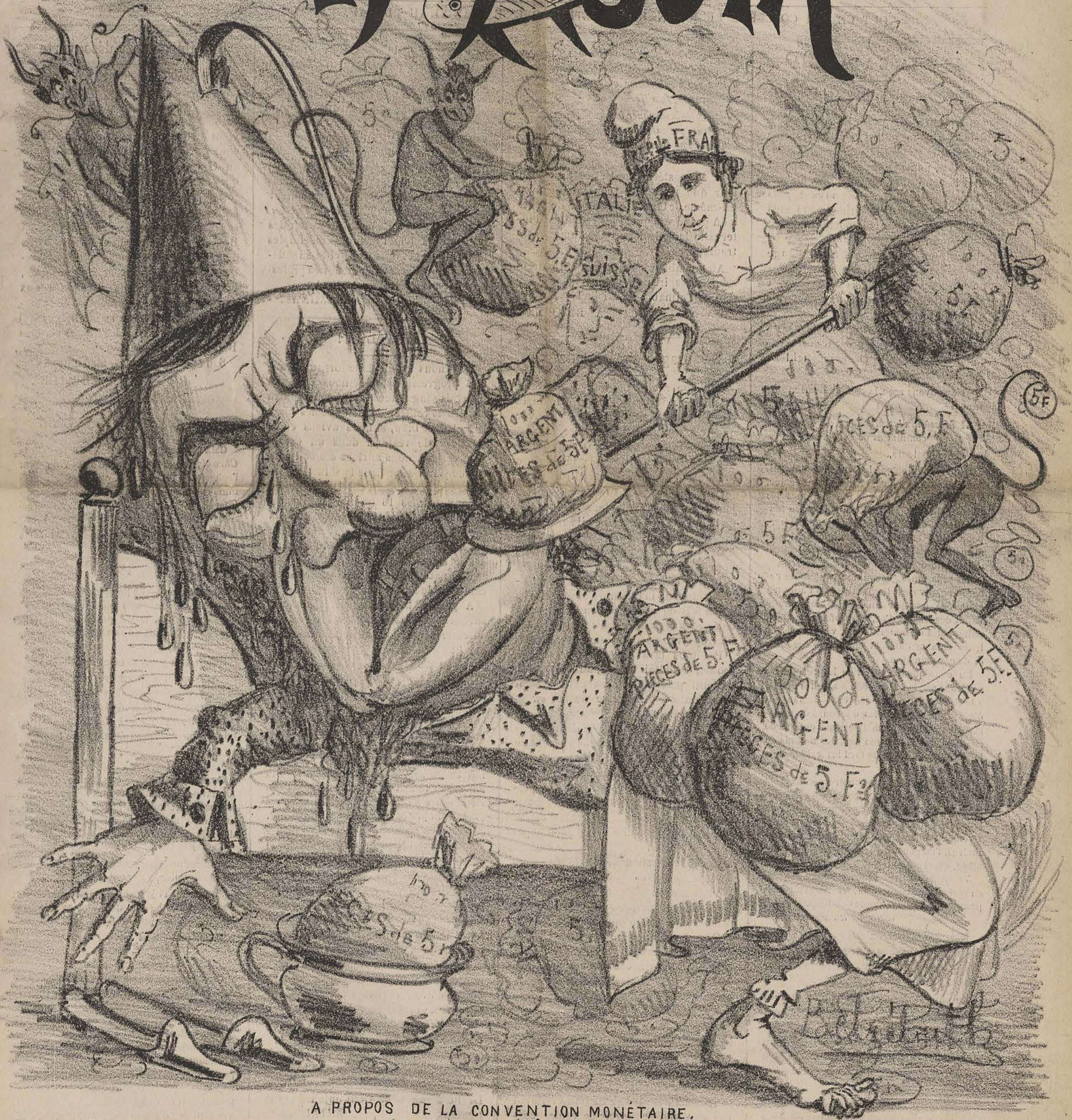
A PROPOS DE LA CONVENTION MONÉTAIRE. Le cauchemar d'Onésiphore.