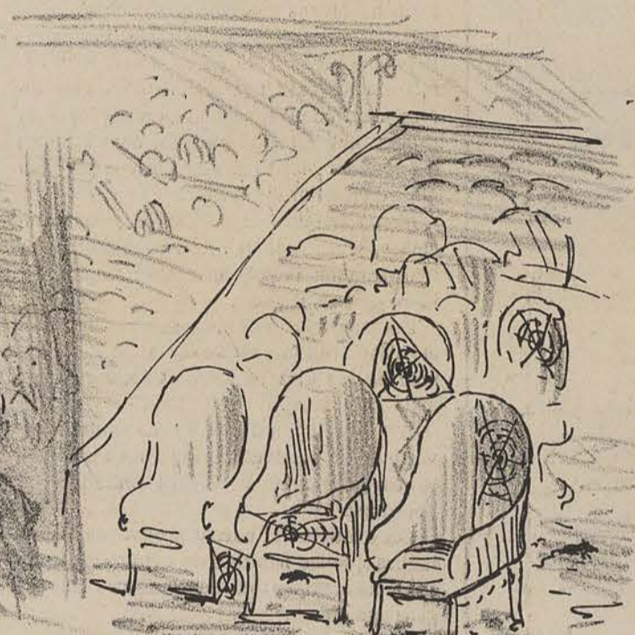
Une séance de la Chambre des Représentants. Aspect des bancs de la gauche.

Oui, Messieurs, je le répète, si vous me faites l'honneur de m'accorder vos suffrages, personne plus que moi ne se montrera soucieux de vos intérêts. J'en ferai un véritable devoir d'être toujours à mon poste etc etc.