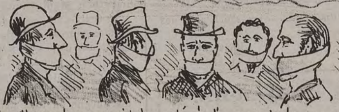
Nouvel appareil breveté à l'usage de la presse imaginé par le sympathique Mr Woeste, ministre de la Justice (?)