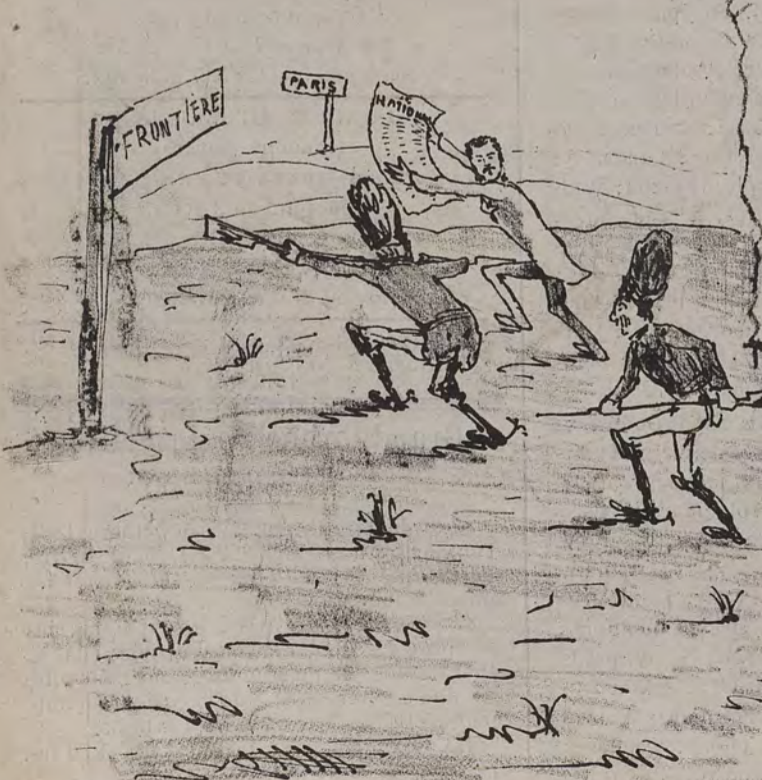
L'hospitalité belge sous un ministère clérical