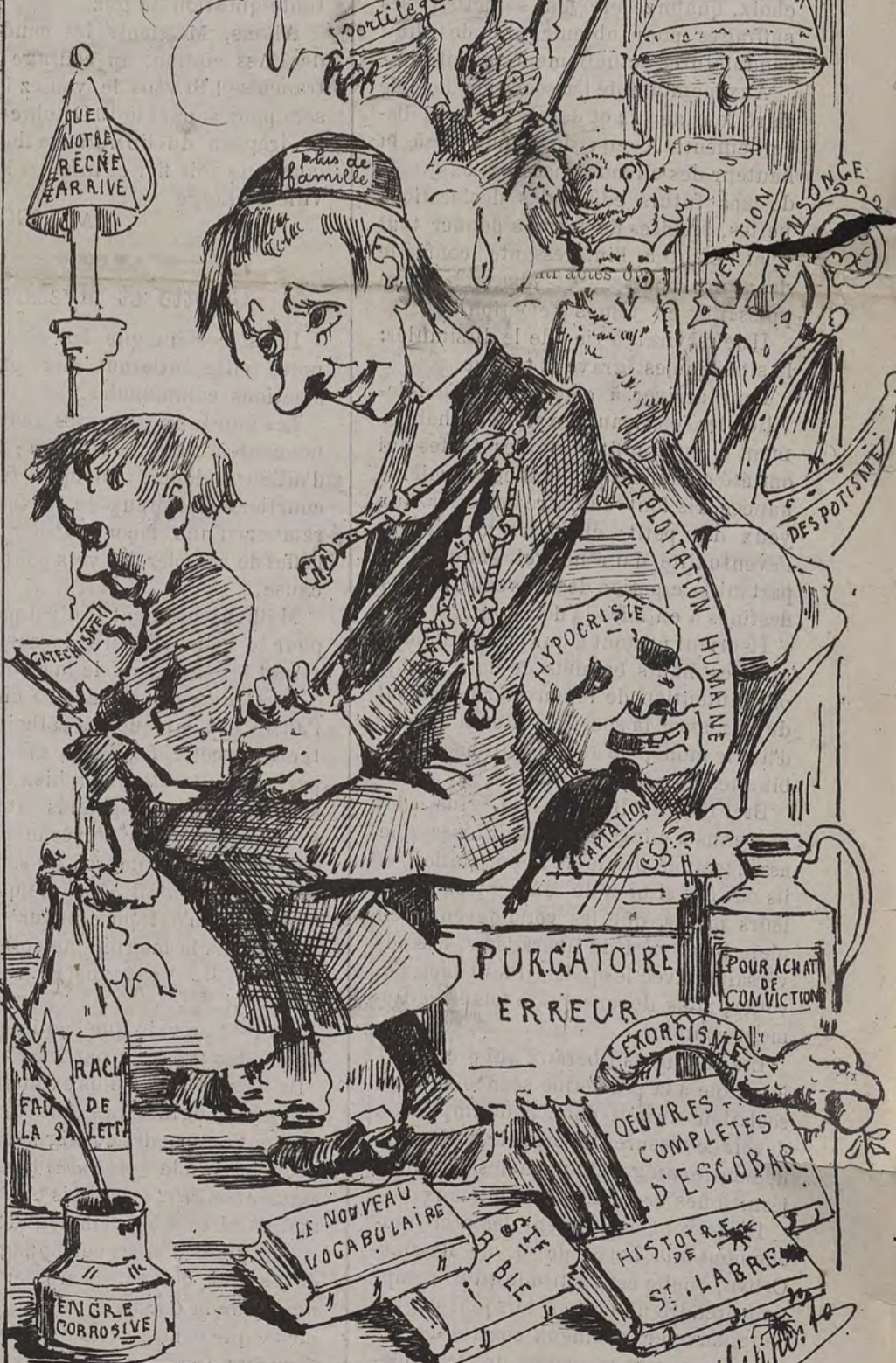
Ecole laïque. - Programme