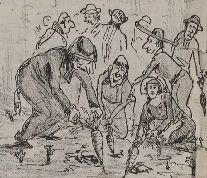
La récolte des carottes sera extraordinairement abondante cette année! - Dame! nous avons un ministre de l'agriculture!