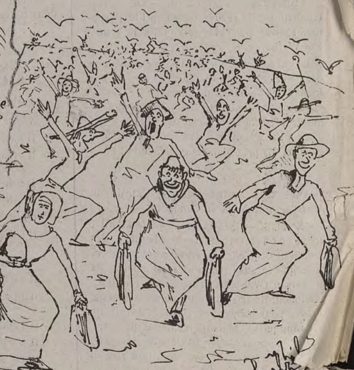
Il y aura dans tous les cas compensation. Un d'expulsé, dix mille d'accueillis!!!