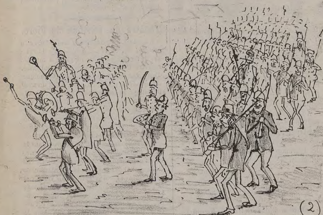
(2) La même Garde civique lorsqu'il s'agit d'escorter un copain qui a obtenu un 87,5 prix de tir.