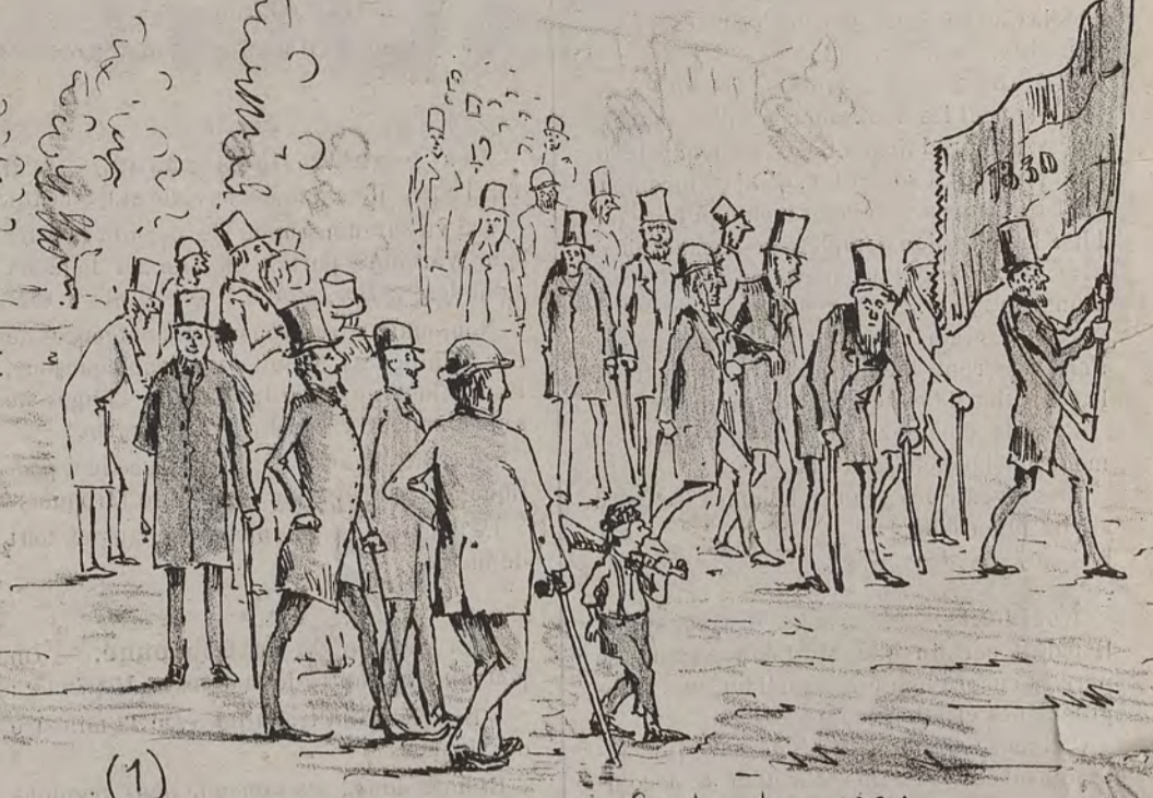
(1) 30 Septembre 1884 Empressement de la Garde civique Liégeoise à fournir une escorte d'honneur aux anciens combattants de 1830