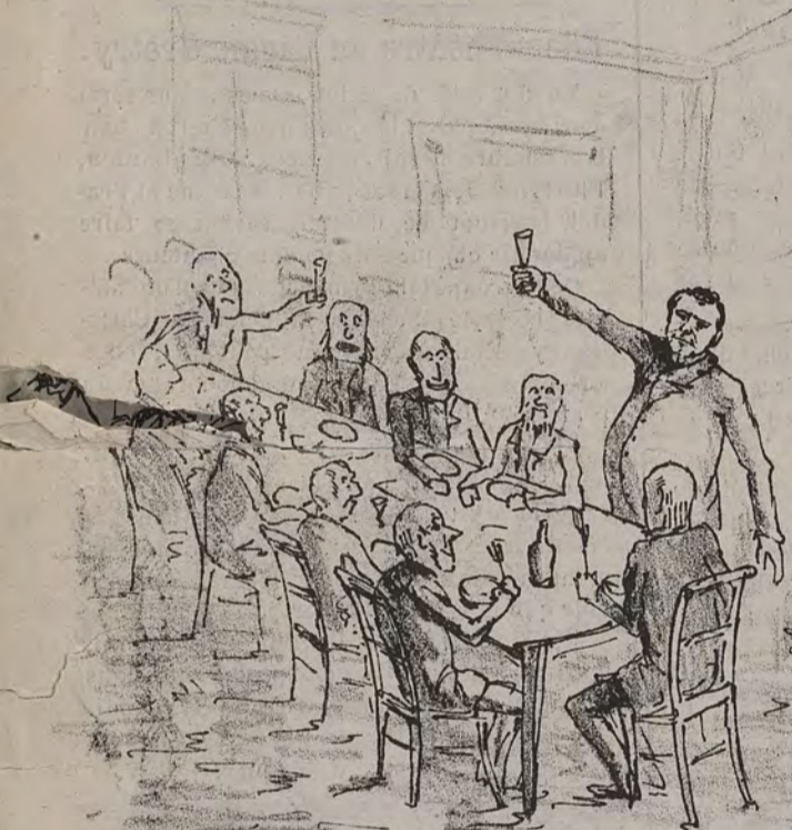
Au banquet des combattants de 1830 (Le toast du vieux caporal.) "Tous ici nous avons combattu le bon combat; vous pour conquérir la liberté, moi pour conquérir la croix des chevaliers sauveteurs des Alpes maritimes."