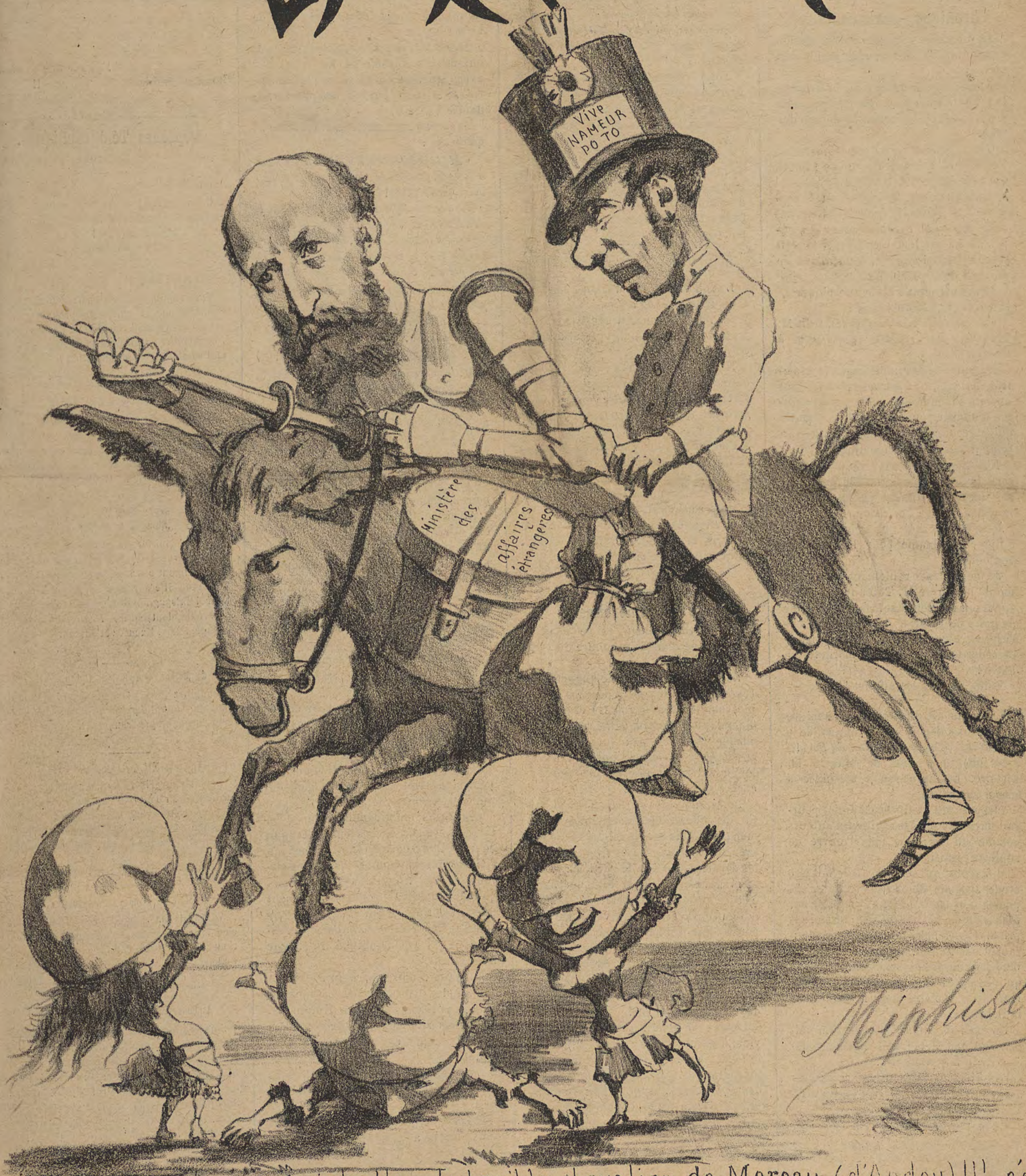
Le Nouveau don Quichotte, le terrible chevalier de Moreau (d'Andoy) !! s'en allant en guerre contre toutes les républiques du monde !!!!