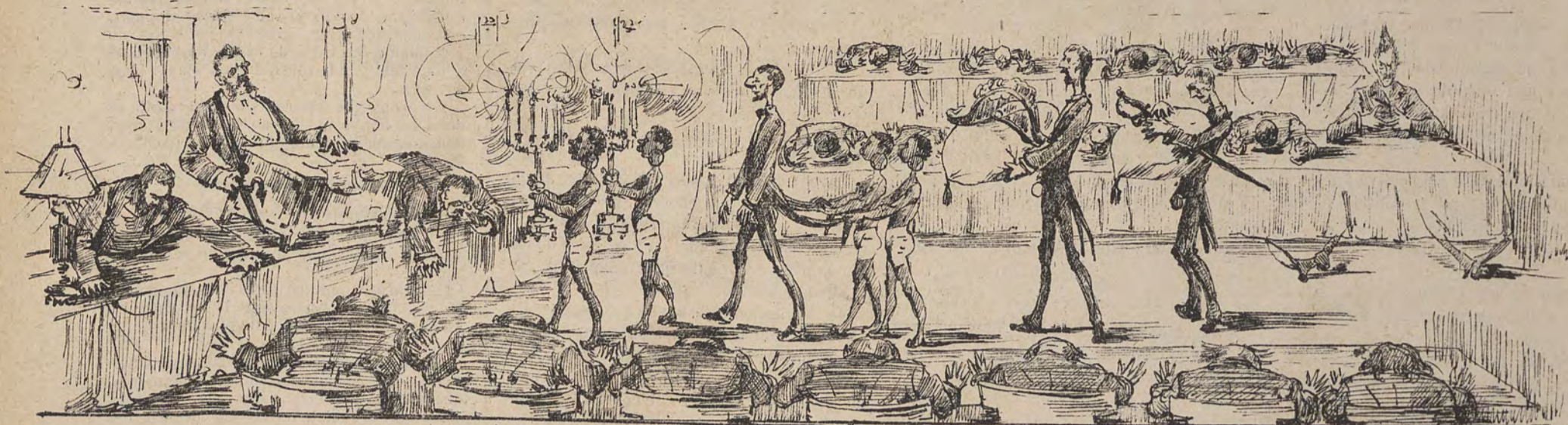
Installation du nouvel échevin des travaux