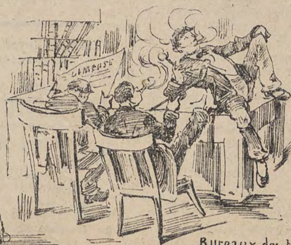
Sous l'ancien régime