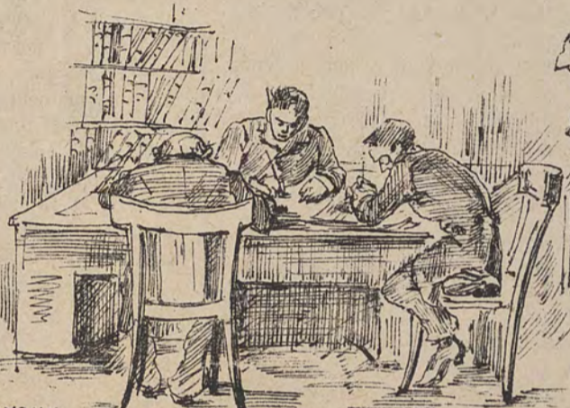
Bureaux des travaux sous le règne de M r Renier Malherbe