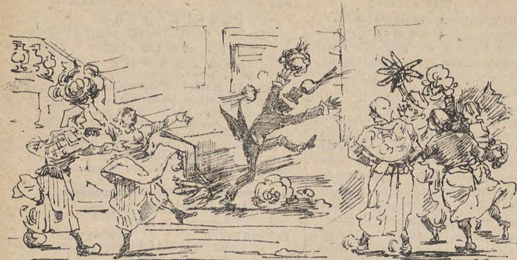
Manifestation sympathique des dames du marché en l'honneur d'un fiancé en retard.