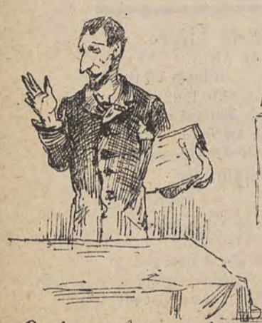
Prestation de serment du nouvel échevin des travaux