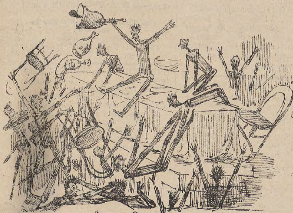
Croquis Brusselaire Episode des meetings farocraies