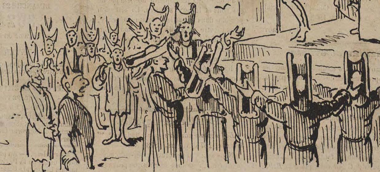
Les électeurs d'Helmet.