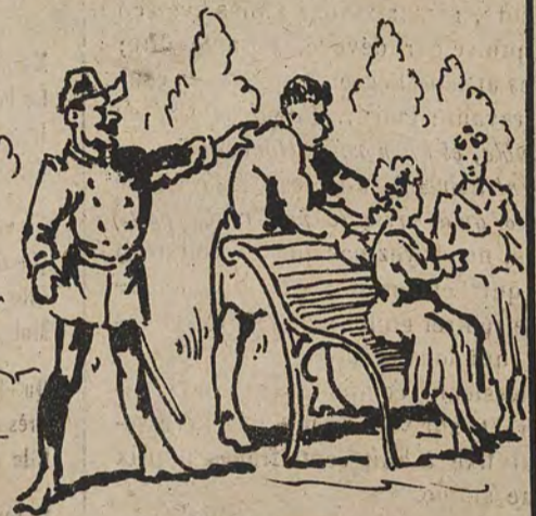
A la Boverie.