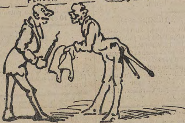
PLACEMENTS POUR GOUVERNEMENTS

— Tiens, Caraman, — Ce cher Ruzette ! — Quelle compensation vont nous allouer les cléricaux ? — Oh ! maintenant ils ne disposent plus que des places de sacristains.