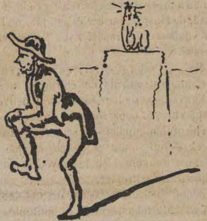
A la Gillette.

— Comment, pas de signatures, des listes vierges ! — C'est tout ce qu'on a trouvé de vierge dans cette commune catholique. — Cependant elle est administrée par un vilain.