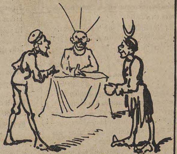
Devant le commissaire.

— Je demande une indemnité à ce vieux sapajou de Turc. — Mais vous voulez lui prendre sa montre ! — Pourquoi qu'il s'est défendu ? — Au fait, pourquoi ? Eh bien ! gardez la chaîne.