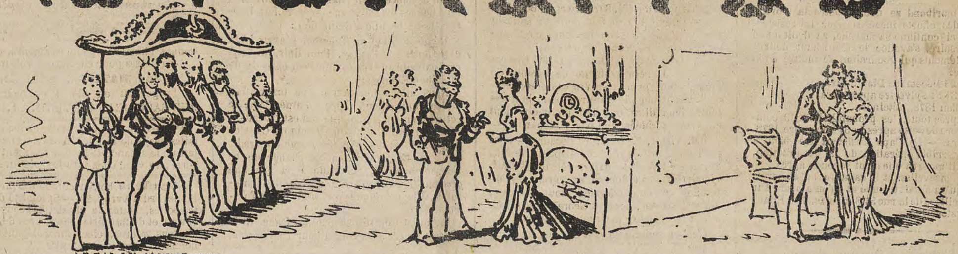
LE BAL DU GOUVERNEUR.