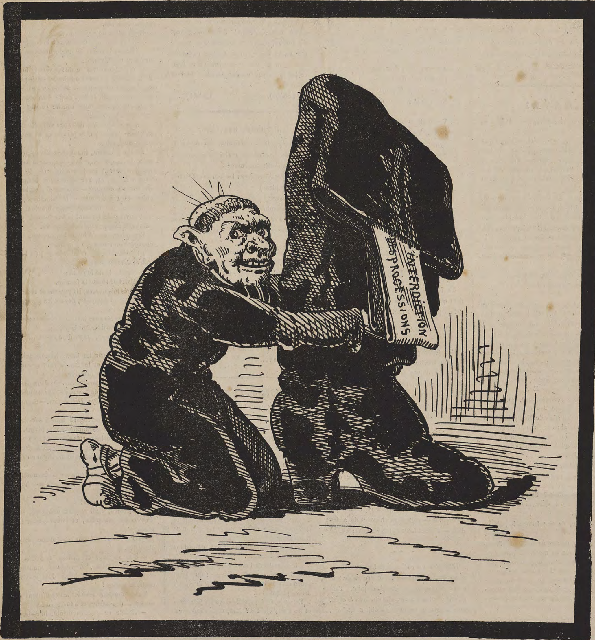
La botte du Mayor.

Journal satirique paraissant tous les quinze jours.