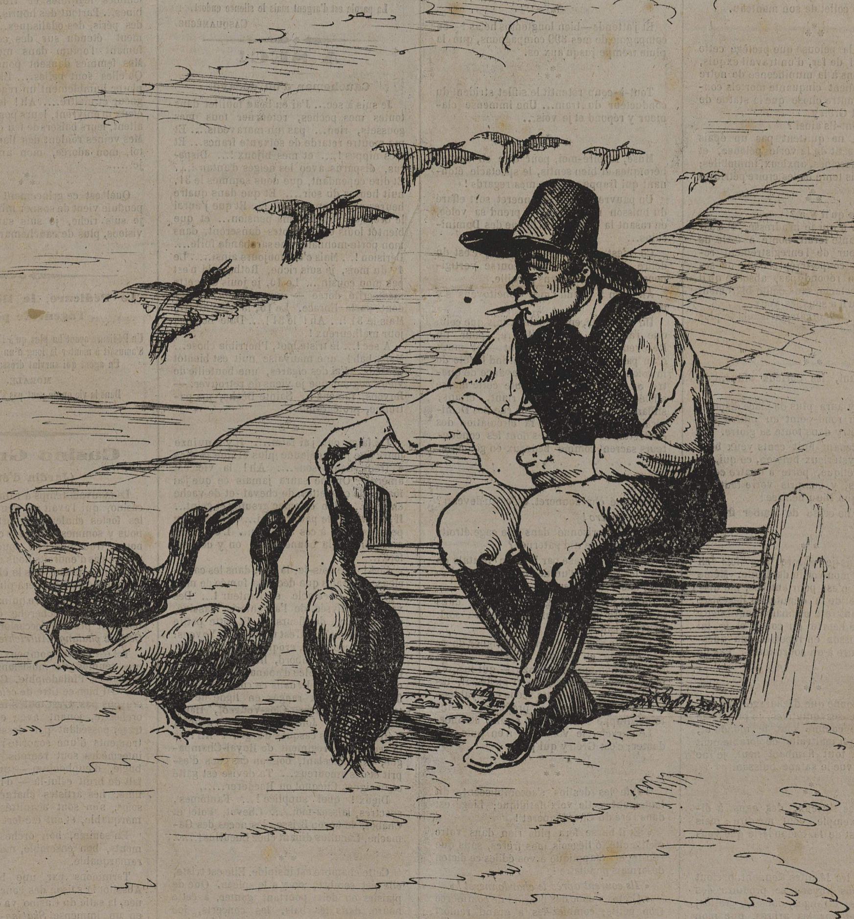
Correspondant Turc à l'ouvrage. (dessin de Kladderadatsch)