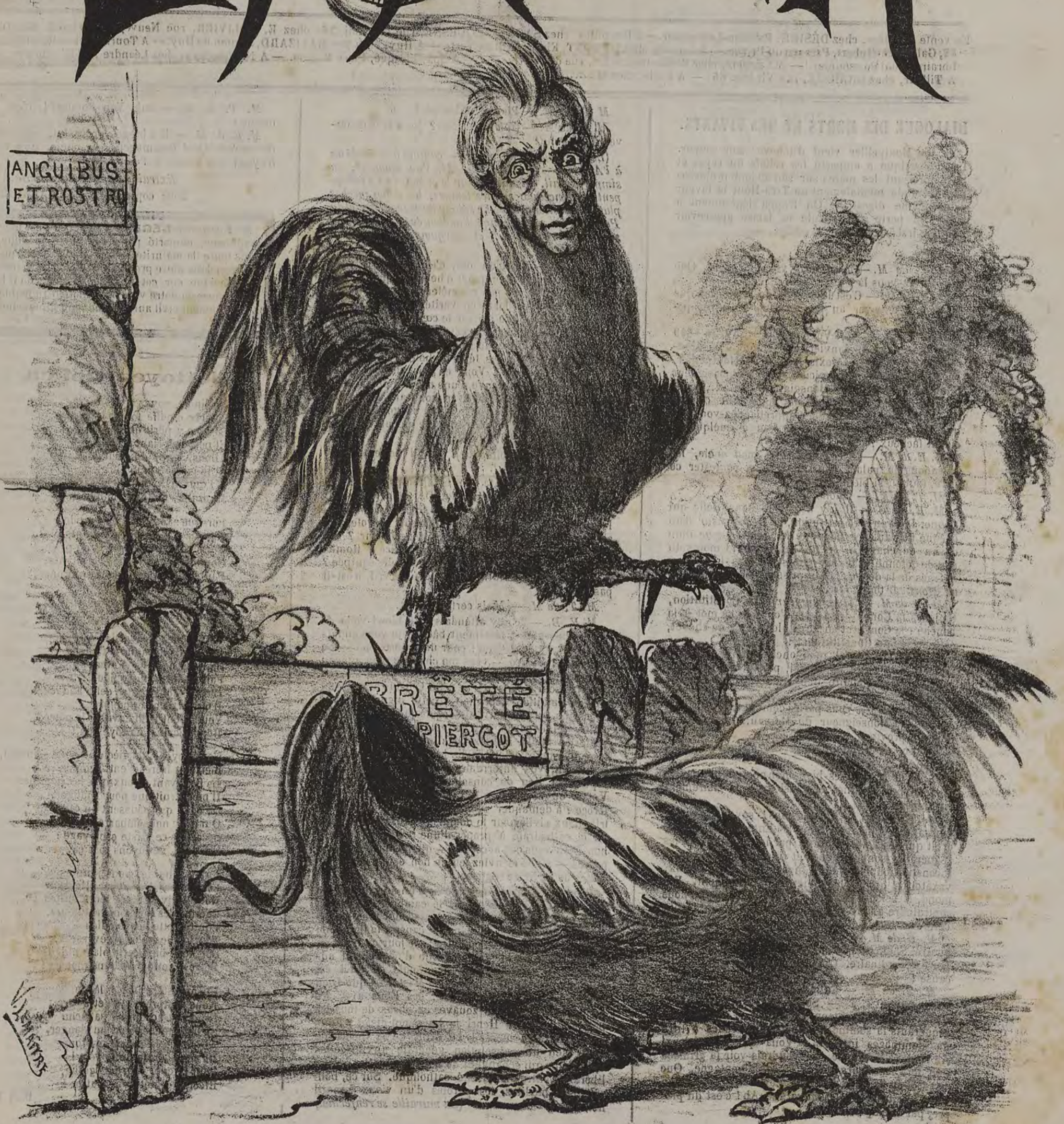
Grand et mémorable combat entre Théodore, chapon ultramontain, et Ferdinand coq champion du pouvoir civil.