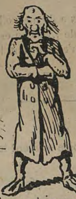
-Si je demandais ma mise à la retraite? à moins de ne rien me donner, j'aurais toujours bien autant que mes appointements.