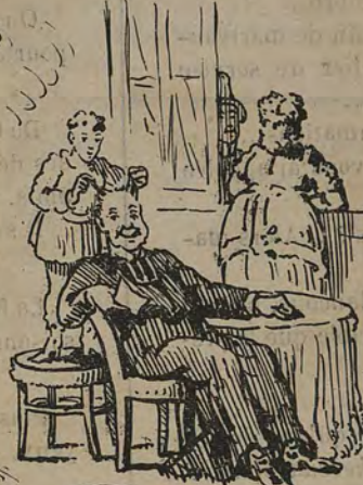
-pire que ce bonheur ne nous était pas permis, être marié!