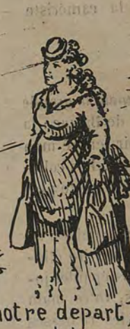
-Différons notre départ, le tricorne est trop dangereux