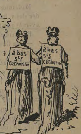
-Les vieilles filles se rendant à Rome pour que le mariage des prêtres soit autorisé.