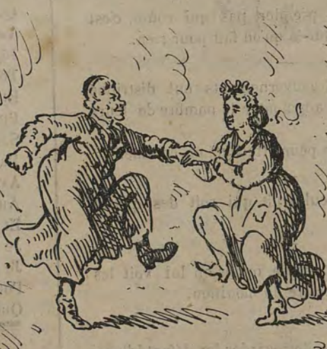
-Gai, gai, marions-nous... Vive le père Hyacinthe!