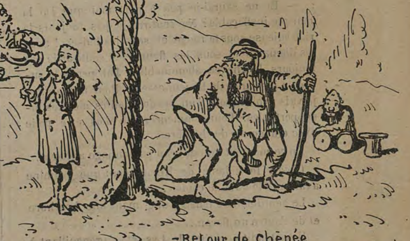
-Retour de Chénée -nous sommes-nous amusés mon Dieu!