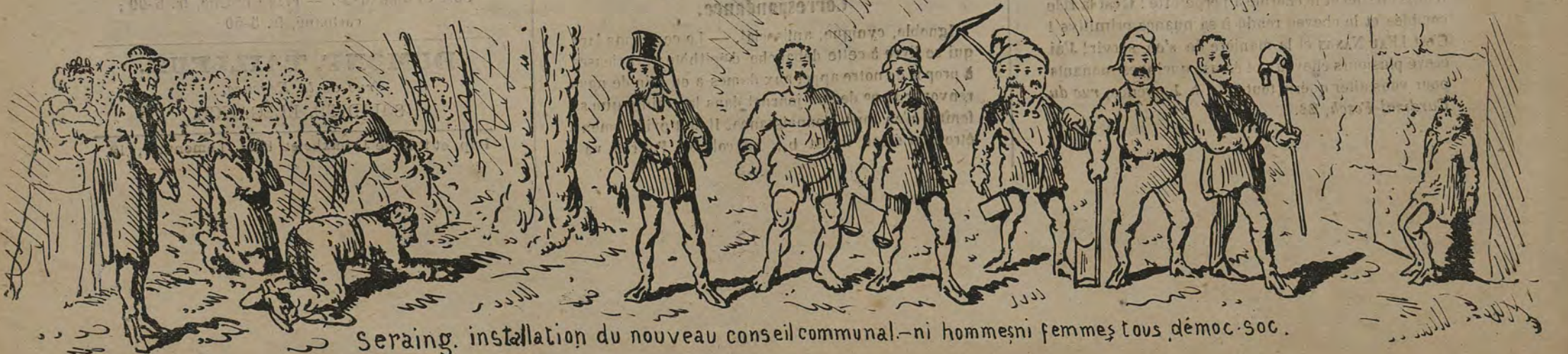
Seraing, installation du nouveau conseil communal - ni hommes ni femmes tous démoc. soc.