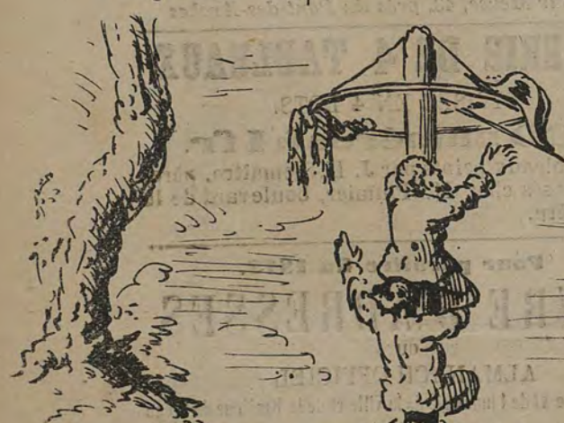
Le conseil communal de Chénée, prend part aux jeux populaires - Petits fils de Nolger au Siège de Chevremont.