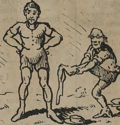
-Ensuite du rapport de la fédération de gymnastique, les instituteurs changent de costume.