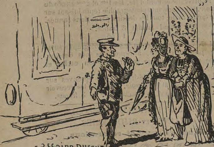
-Affaire Dufour. -Est-ce pour attentat aux mœurs? Éteignez la lampe, s v p.