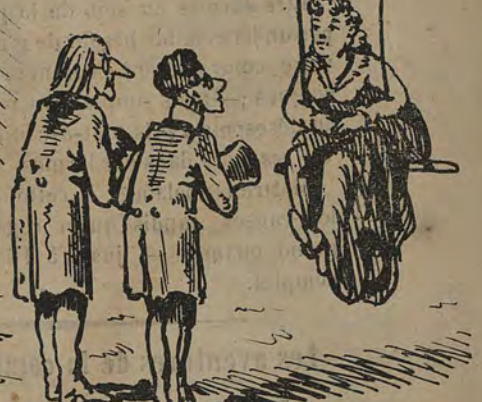
-Mais monsieur l'inspecteur, je ne puis pourtant pas faire le cumul sur un trapèze, une institutrice doit avoir des formes! -C'est ce dont nous voulons nous assurer.