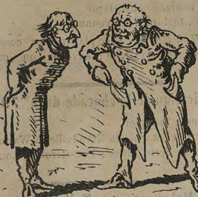
A propos des instituteurs. -Fonder une caisse de retraite, c'est bien, mais que pourrions-nous bien mettre dedans?