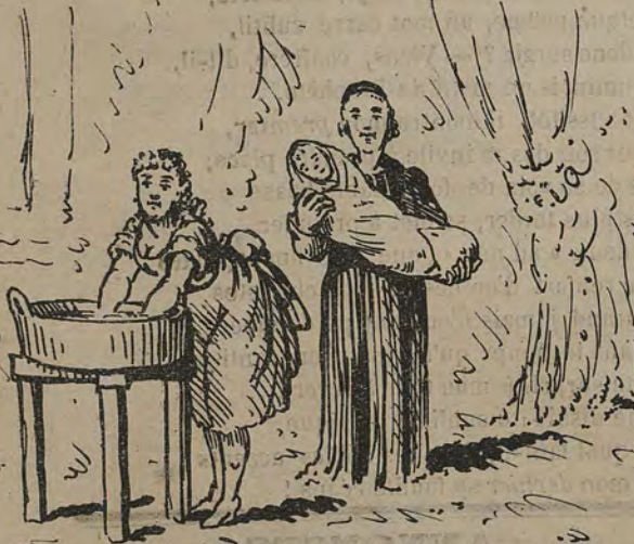
-Transformation du clergé par suite de l'abolition du célibat.