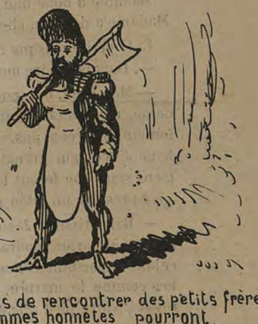
-A moins de rencontrer des petits frères, les femmes honnêtes pourront, sous ce costume, voyager sans inquiétude.