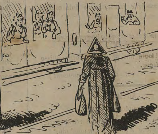
-Depuis l'affaire Dufour, les révérends ont la vogue en voyage.