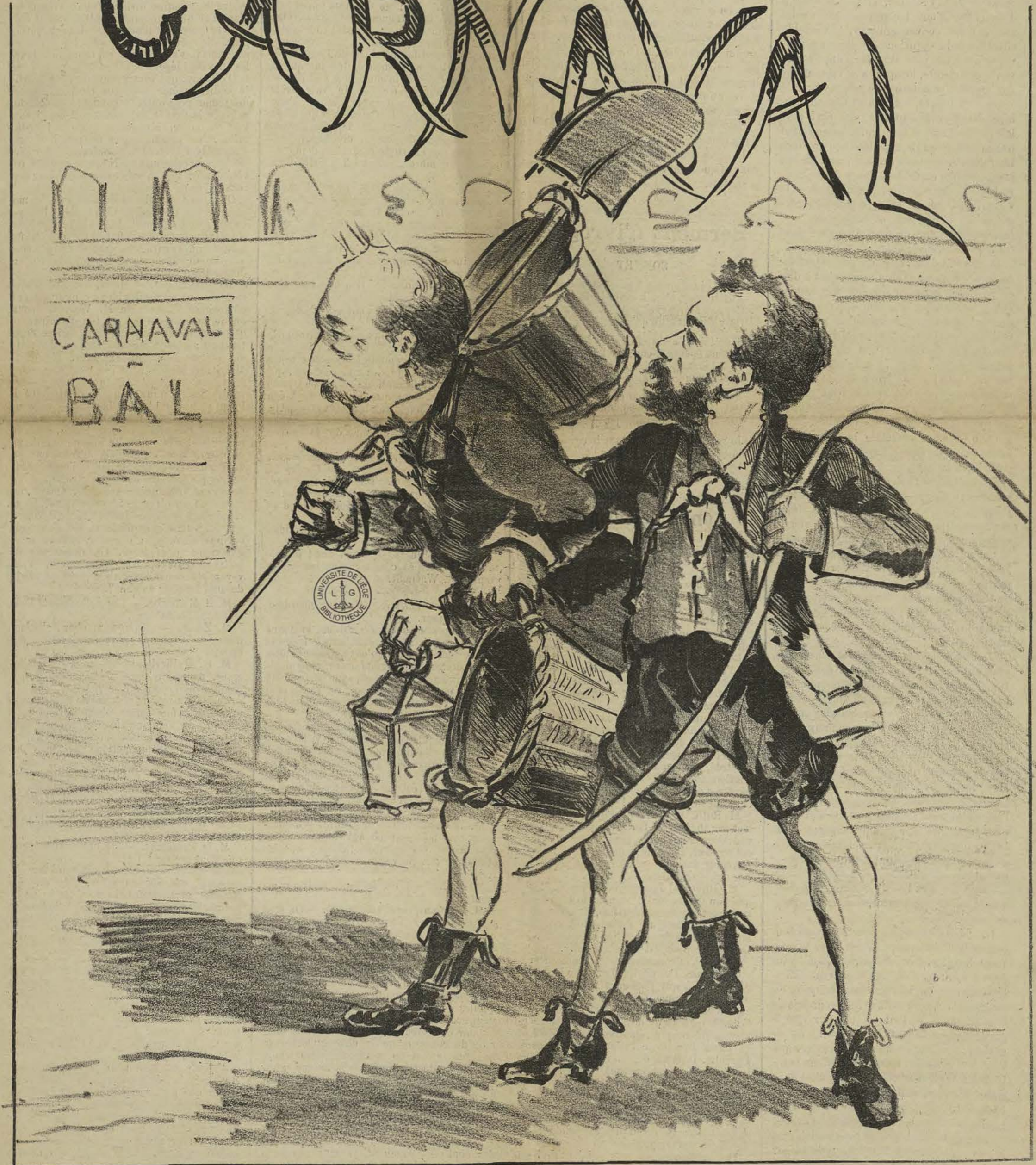
Un costume sous lequel ils ne seront jamais reconnus.