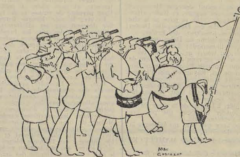
La vieille Harmonie qui passe