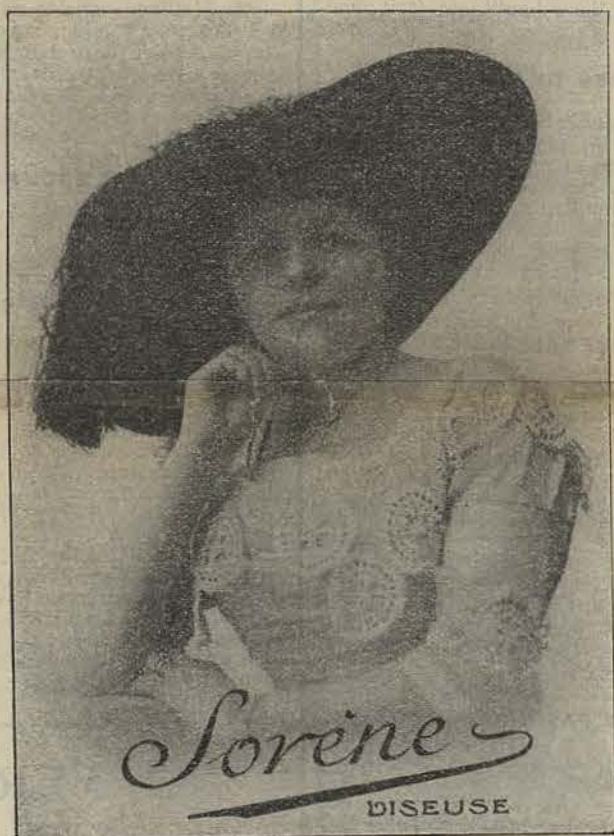
La Commère de la Revue